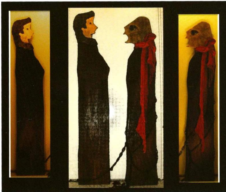
La belle et la bête (trittico)